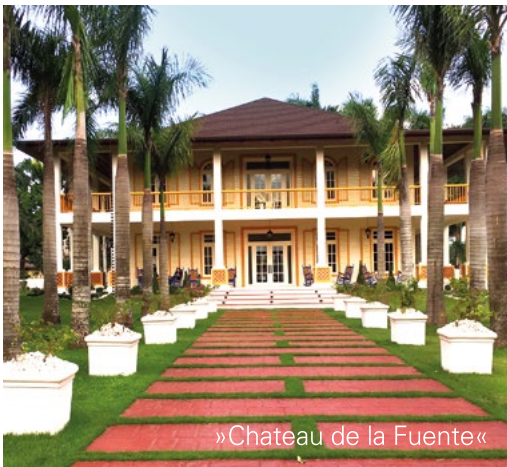
»Chateau de la Fuente«