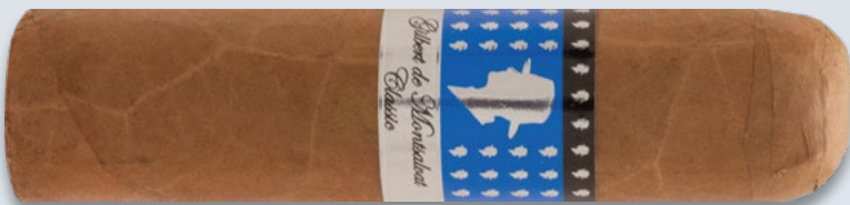
Chunky (Short Gordo) | Artikelnr. 1502763 | ◆ 101 mm | Ø 23,8 mm | VE: 10 Stück | 5,20€/St.

sich mit Noten von Kakao und dunkler Schokolade und gipfelt in einem Anklang von getrockneten Pflaumen und sensationeller Natursüße. Zusammengefasst eine sanft bis mittelkräftige, herausragende Zigarre aus Nicaragua mit einem starken Preis-Genuss-Verhältnis. ■