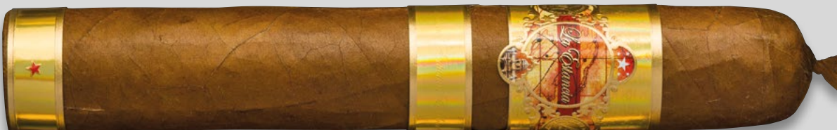
60 (Gigante) | Artikelnr. 1502769 | ♦ 152mm | Ø 23,8 mm | VE: 10 Stück | 31,00€/St.