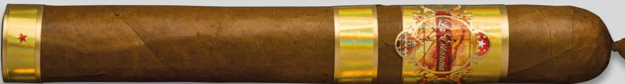
56 (Toro) | Artikelnr. 1502768 | ♦ 165mm | Ø 22,6 mm | VE: 10 Stück | 28,00€/St.

Das ist der Punkt, an dem die Wissenschaft aufhört und wahre Kunst beginnt... Lehnen Sie sich zurück, entspannen Sie sich und genießen Sie unsere Leidenschaft! ■