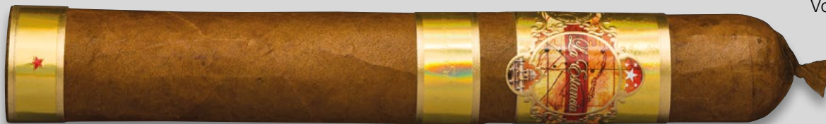
52 (Robusto) | Artikelnr. 1502767 | ♦ 148 mm | Ø 20,6 mm | VE: 10 Stück | 25,00€/St.

ein Feuerwerk an Aromen! Die »Edición Exclusiva« entwickelt eine intensive Süße, die beispiellos lange am Gaumen verweilt. Diese Zigarre ist ein Fest, nicht nur wegen der gigantischen Rauchentwicklung, sondern vor allem aufgrund der vielschichtigen Aromatik. Eine feine Würze begleitet Sie bis zum Ende, nimmt sich jedoch ab und zu zurück, um Ledernoten und süffigen Aromen den Vortritt zu lassen.